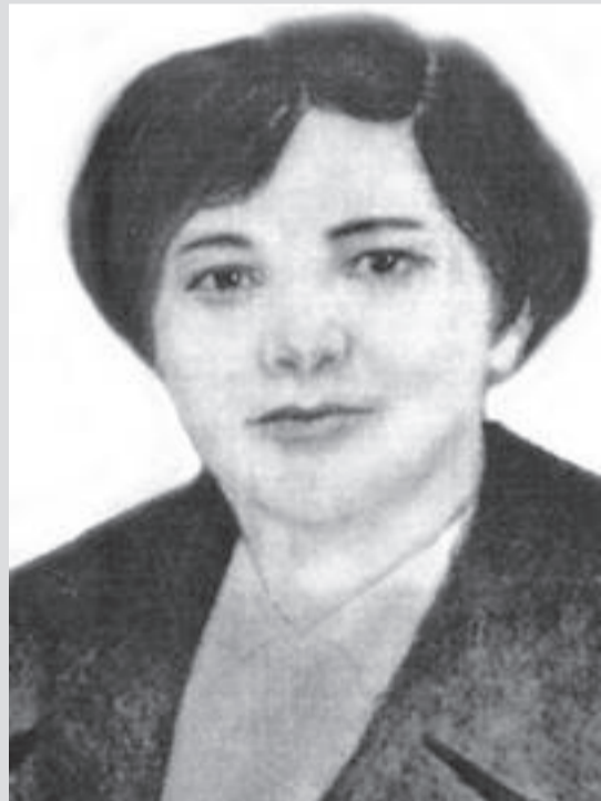
«Қырық бірінші» (1928) сияқты шығармаларымен таныстырды.