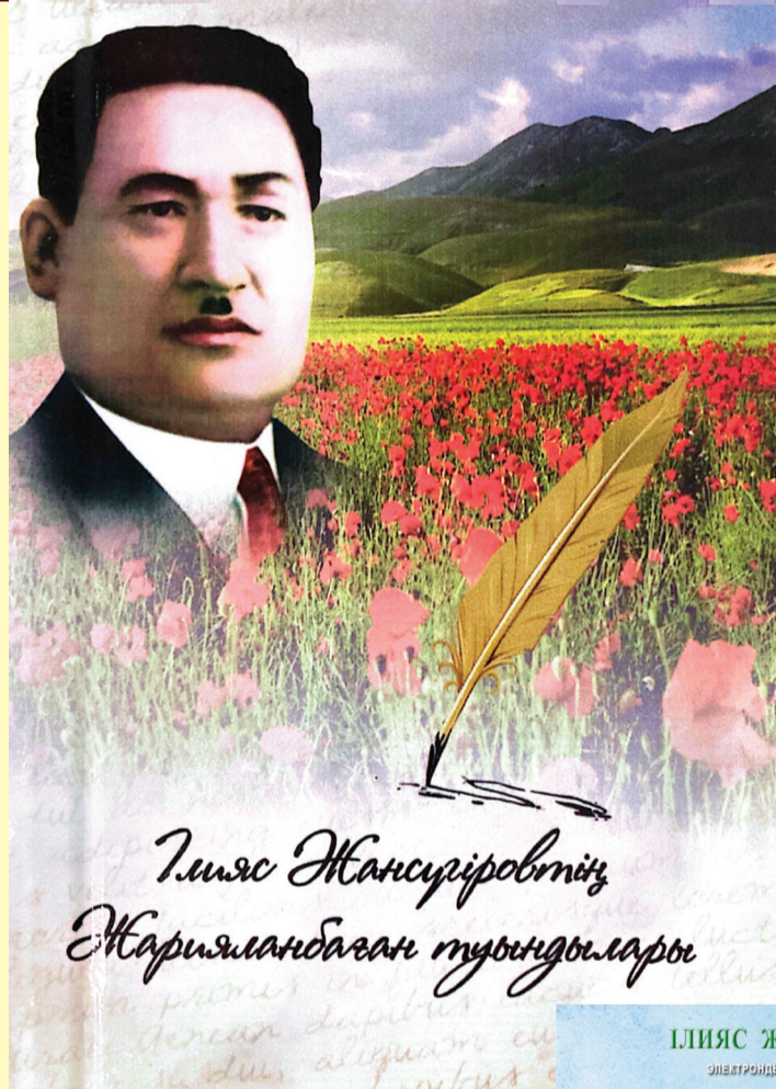
Ілияс Жансүгіровтің жарияланбаған туындылары

Адамзаттың ақыл-ойына үлес қосқан, ұлтының болашағы үшін күрескен даналардың өмір сүруінің өзі – құбылыс. Әлихан Бөкейхан, Ахмет Байтұрсынұлы, Міржақып Дулатұлы, Мағжан Жұмабаев, Әлімхан Ермекеұлы, Сұлтанбек Қожанұл, Мұхамеджан Тынышбаев, Смағұл Садуақасов, Жүсіпбек Аймауытов, Ілияс Жансүгіров, Сәкен Сейфуллин, Бейімбет Майлин сынды алаш арыстарының бақыты да, трагедиясы да қалың жұрттан өзгеше озықтығында, қайталанбас жалғыздықтарында. Олар – XX ғасырдың басында дүниеге жаңа көзқараспен үрдіс келіп қосылған тұлғалар.